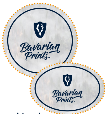
rund / oval